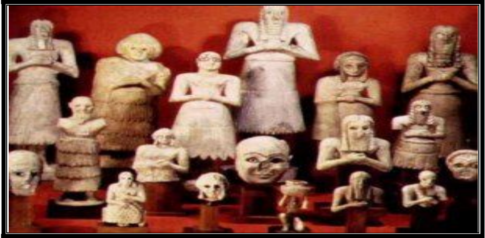
تمائيل الكهنة وهم في حالة تعبد والصلاة